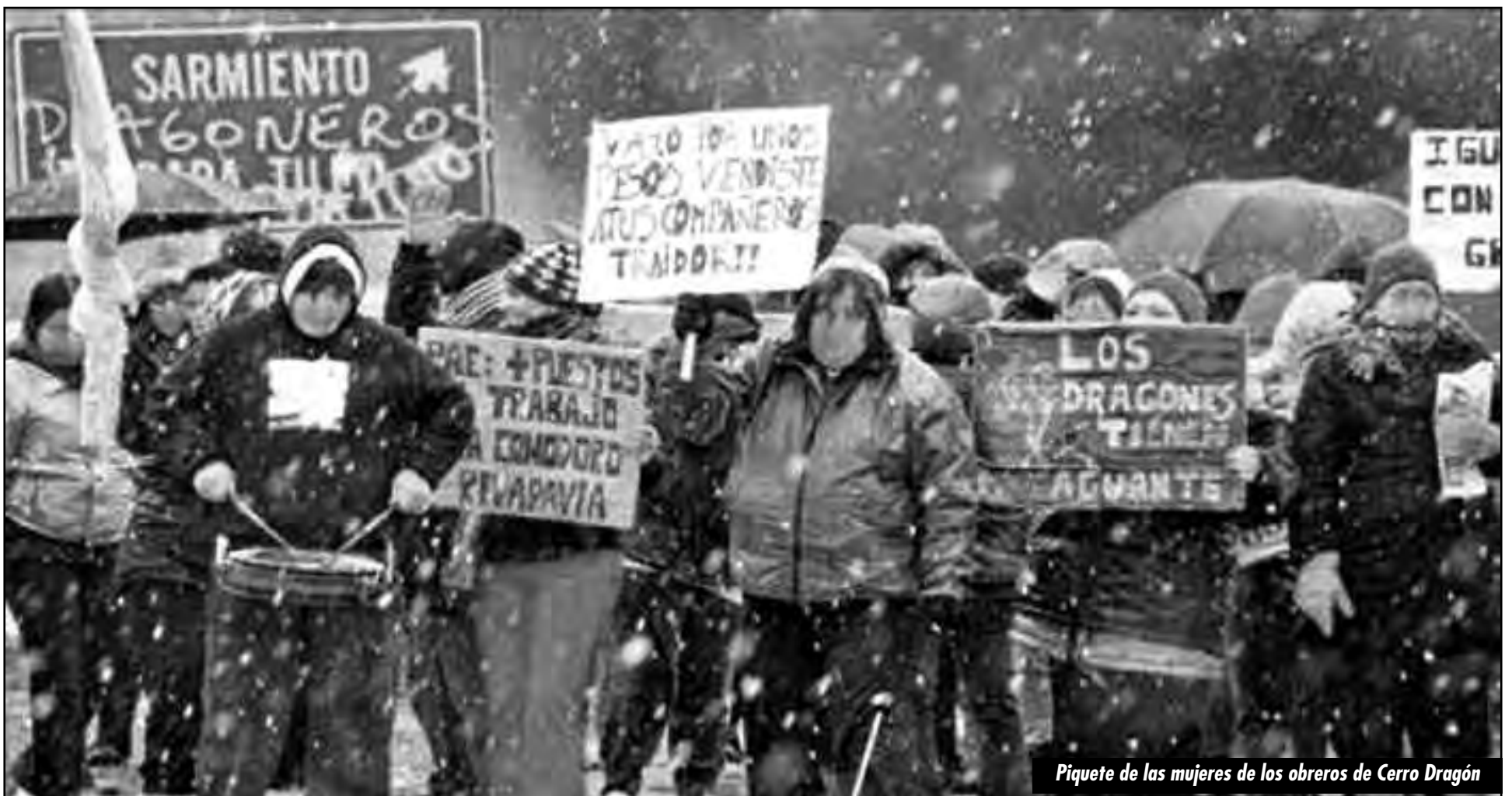
Piquete de las mujeres de los obreros de Cerro Dragón

de la mano de sus principales candidatos, llamaban a "cortar boleta" en las elecciones nacionales, para que los que votaban a la Kirchner para presidente, los voten a ellos para el Parlamento. Hace rato que han devenido en la "izquierda del kirchnerato".