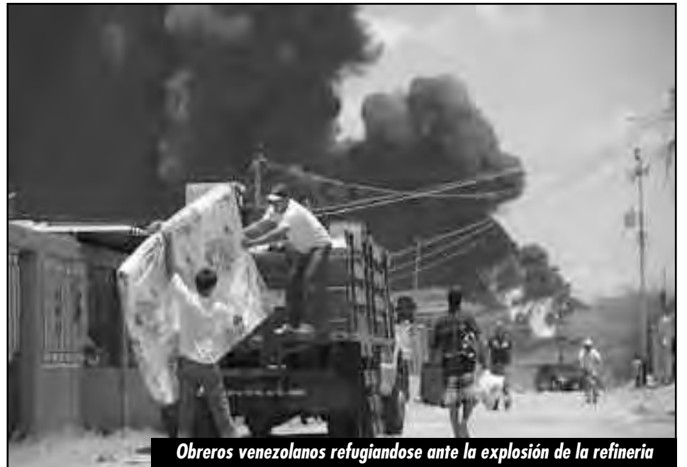
Obreros venezolanos refugiándose ante la explosión de la refinería

La clase obrera es la única que puede impedir nuevas masacres de este tipo, porque es la única clase que puede acaudillar a los explotados en la lucha contra el imperialismo, defendiendo la producción reorganizándola sobre la base de la expropiación de toda la burguesía.