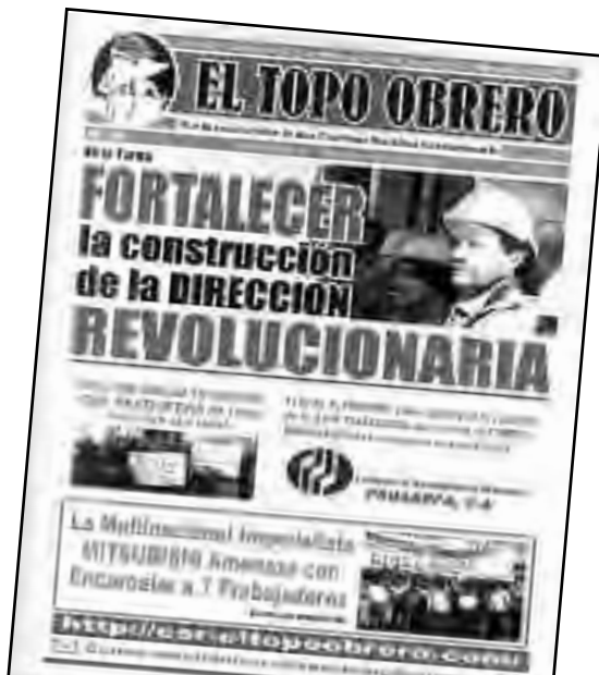
Fascimil de uno de los periódicos del topo obrero

Ante las elecciones presidenciales de Venezuela, los compañeros de la Corriente Socialista Revolucionaria – El Topo Obrero han lanzado una declaración que presenta batalla por conquistar una trinchera internacionalista al interior del proletariado y las masas empobrecidas venezolanas, azotadas por el gobierno de Chávez y su régimen bolivariano. Una declaración política que a su vez concentra una crítica política a la candidatura de Orlando Chirino (UIT-CI / PSL) y sus límites dados por su programa reformista.