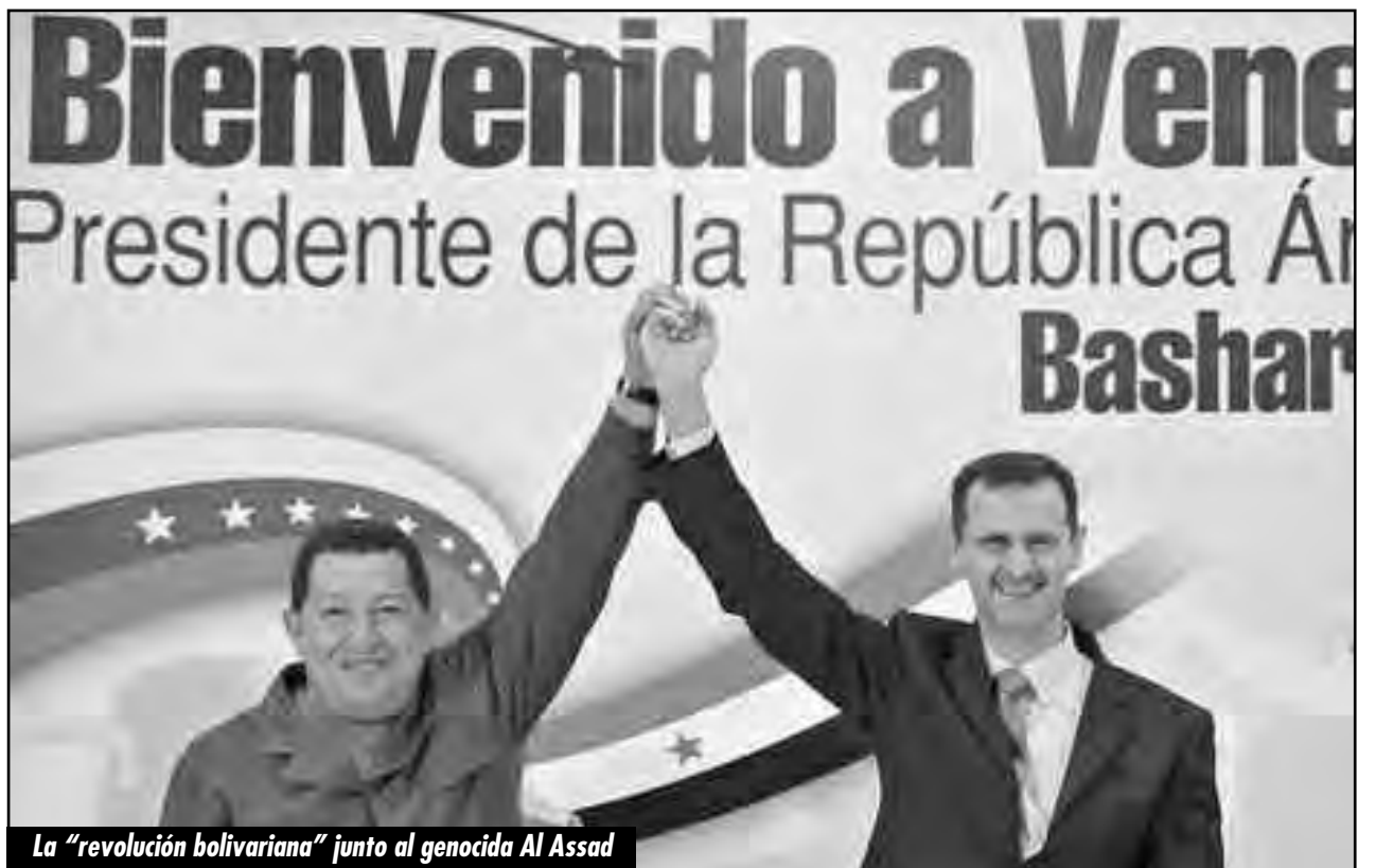
La “revolución bolivariana” junto al genocida Al Assad

Ante la ruptura de enormes franjas de la clase obrera con Chávez, la izquierda reformista de todos colores, intenta posar de “anti chavistas” queriendo “lavar la ropa sucia” de sus capitulaciones y traiciones luego de haber sostenido por décadas a Chávez y al régimen bolivariano centralizados bajo el comando del Foro Social Mundial quien le dio instrucciones a cada paso de cómo