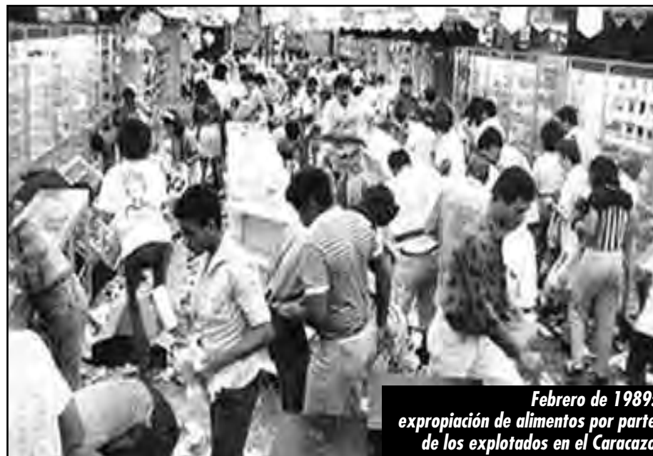
Febrero de 1989: expropiación de alimentos por parte de los explotados en el Caracazo

De aquí surge nuestra consigna para enfrentar a los Kirchner, a los Morales e inclusive a los Castro y Chávez, de “contra la caricatura de revoluciones bolivarianas, por la revolución obrera y socialista”. Ese es el carácter y el contenido de nuestra definición.