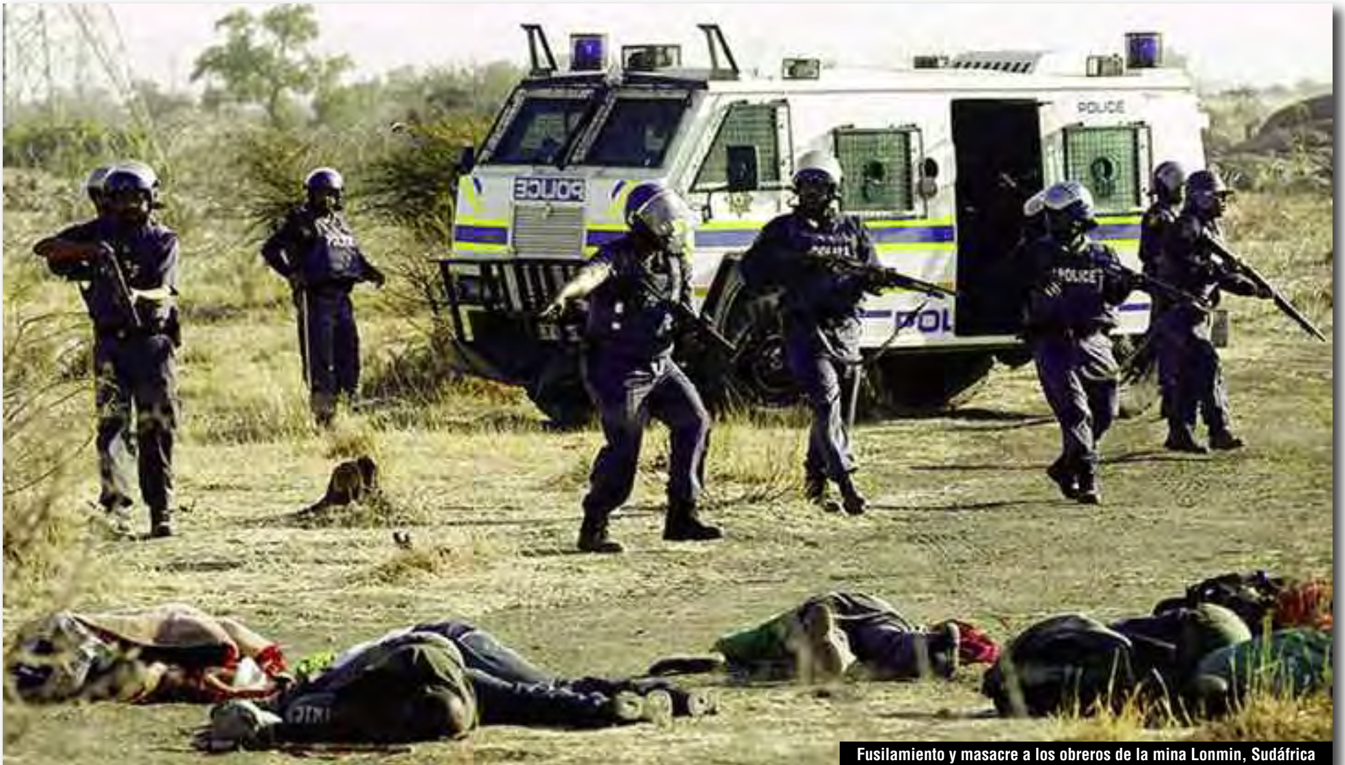
Fusilamiento y masacre a los obreros de la mina Lonmin, Sudáfrica

El gobierno asesino y lacayo del imperialismo de Zuma y el Congreso Nacional Africano (CNA), ha descargado su represión violenta y una vil masacre contra los trabajadores de la mina Lonmin en la localidad de Marikana, que se encuentran en huelga. El 16/8 38 obreros fueron asesinados por la policía del régimen infame de la “reconciliación” de Mandela y el estalinismo con la burguesía blanca del Apartheid.