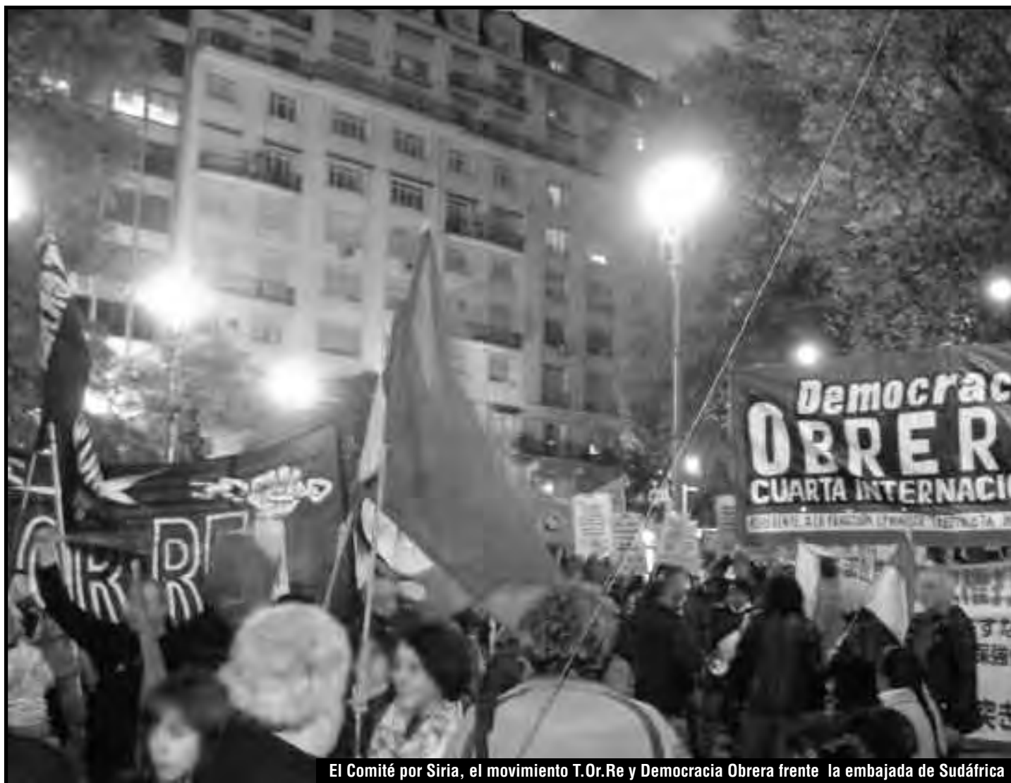
El Comité por Siria, el movimiento T.Or.Re y Democracia Obrera frente la embajada de Sudáfrica

la FLTI por los compañeros de la JRCL-RMF y los estudiantes Zengakuren de Japón, quienes recibieron la bandera del Comité por Siria en Argentina en la 50° Asamblea Internacional Antiguerra que viene de realizarse en Tokio, donde juntos peleamos por la moción de conquistar un Comité Internacional en defensa de las masas sirias.