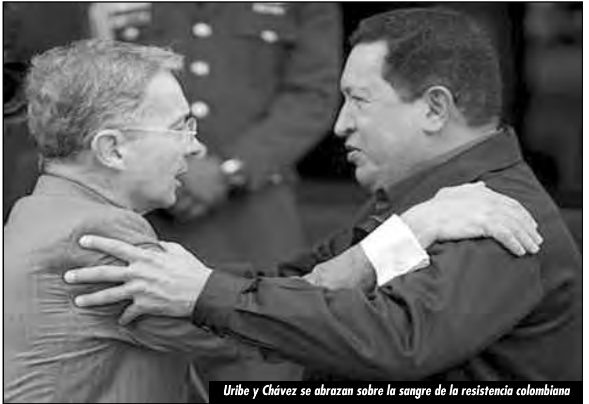
Uribe y Chávez se abrazan sobre la sangre de la resistencia colombiana

A continuación entonces le presentamos a los revolucionarios venezolanos y a la vanguardia proletaria nuestro humilde aporte desde la FLTI a este combate fundamental al cual debemos volcar todas nuestras fuerzas.