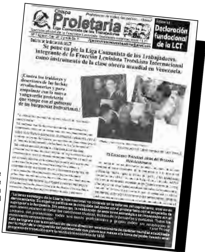
Fascímil del periódico N°1 de la Liga Comunista de Trabajadores con su Declaración fundacional

impuestas con referéndums bonapartistas, en su mayoría apoyados por Chirino y sus seguidores, figura la defensa incondicional de la propiedad privada de los capitalistas. Este régimen bolivariano y su constitución prohíben, por dar solo un ejemplo, el derecho a huelga en las empresas “nacionalizadas” por considerarlo un “boicot a la patria” y pena a los obreros con cárcel si salen a la huelga. Es el régimen que con sus Fuerzas Armadas reprimen, persiguen, desaparecen y matan dirigentes y luchadores revolucionarios, dejándole el camino libre a la patronal para organizar el sicariato asesino de obreros y campesinos: fueron asesinados más de 300 campesinos pobres, 3 obreros en Aragua, 3 en la Mitsubishi y Vivex en Anzoátegui, un obrero en la Toyota de Sucre, etc. Mientras la burocracia sindical traidora frena las luchas y actúa como verdaderos rompehuelgas, delatando a los luchadores.