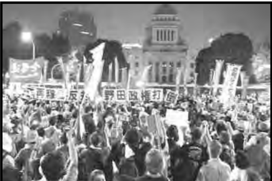
MOVILIZACIÓN DE LA VANGUARDIA OBRERA, LA JRCL-RMF Y LOS JÓVENES ZENGAKUREN, RODEANDO EL PARLAMENTO DE JAPÓN AL GRITO DE “FUERA NODA”.

COMITÉ EJECUTIVO INTERNACIONAL DE LA FLTI