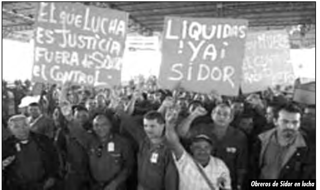
Obreros de Sidor en lucha

A nivel internacional distintas corrientes de los renegados del trotskismo han manifestado su apoyo a la candidatura de Chirino por ser “independiente de Chávez”. Todos quieren usar las elecciones de Venezuela para “lavarse la ropa” de sus capitulaciones y traiciones a la clase obrera, y a su vez poder contener y maniatar a la vanguardia proletaria que ha comenzado a romper con Chávez. Hablan de “independencia de Chávez” la UIT y la LIT que llamaron desde la UNT a juntarle a Chá-