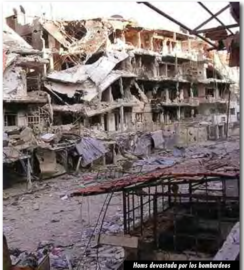
Homs devastada por los bombardeos