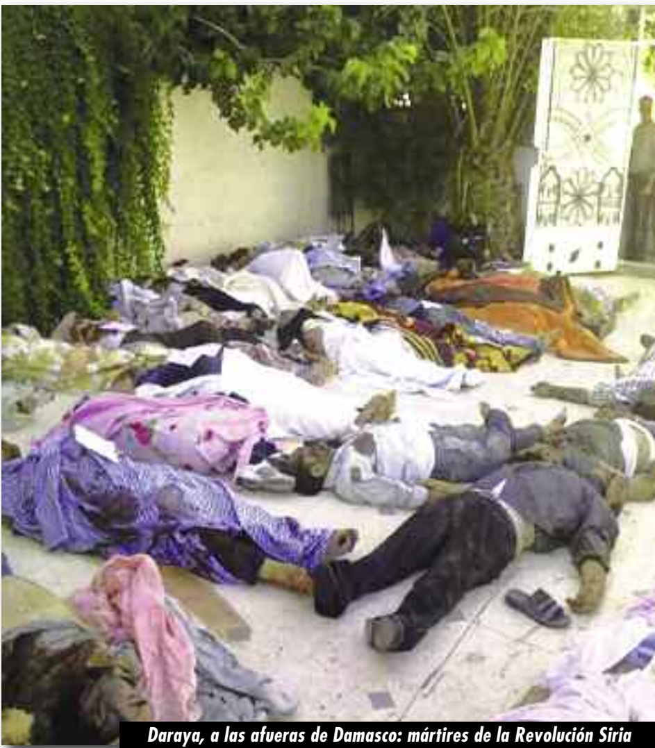
Daraya, a las afueras de Damasco: mártires de la Revolución Siria