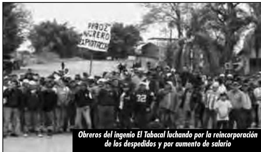
Obreros del ingenio El Tabacal luchando por la reincorporación de los despedidos y por aumento de salario

Por eso es importante y de vida o muerte que la lucha de los obreros de Orán triunfe. Que no haya un solo despido y que vuelvan a ser reincorporados los 2500 tra-