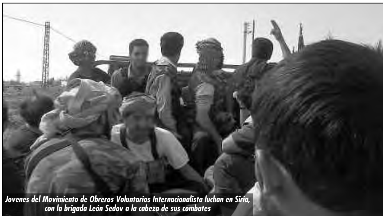
Jovenes del Movimiento de Obreros Voluntarios Internacionalista luchan en Siria, con la brigada León Sedov a la cabeza de sus combates

El ejército de Al Assad y este régimen están cometiendo un genocidio contra el pueblo sirio. Están derrumbando ciudades enteras con sus bombas y