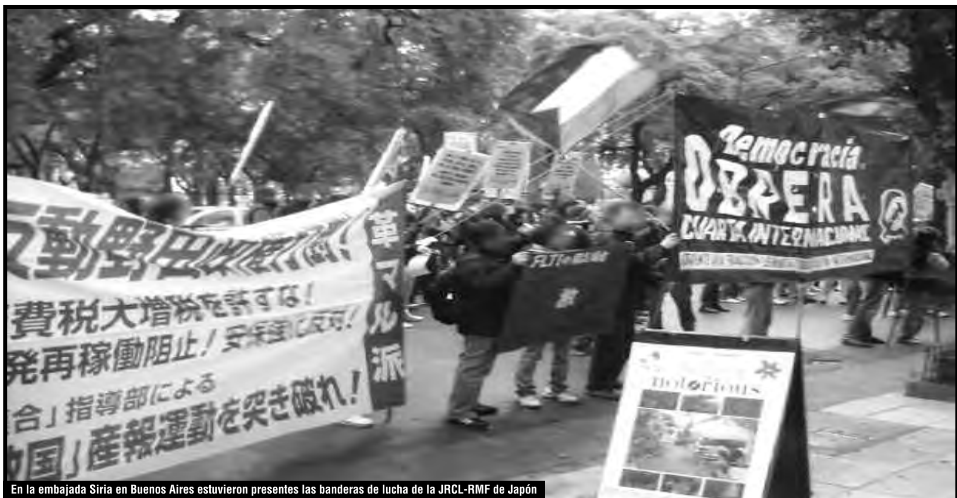
En la embajada Siria en Buenos Aires estuvieron presentes las banderas de lucha de la JRCL-RMF de Japón

Sin lugar a dudas, este es un enorme paso adelante porque significa que la moción inter-