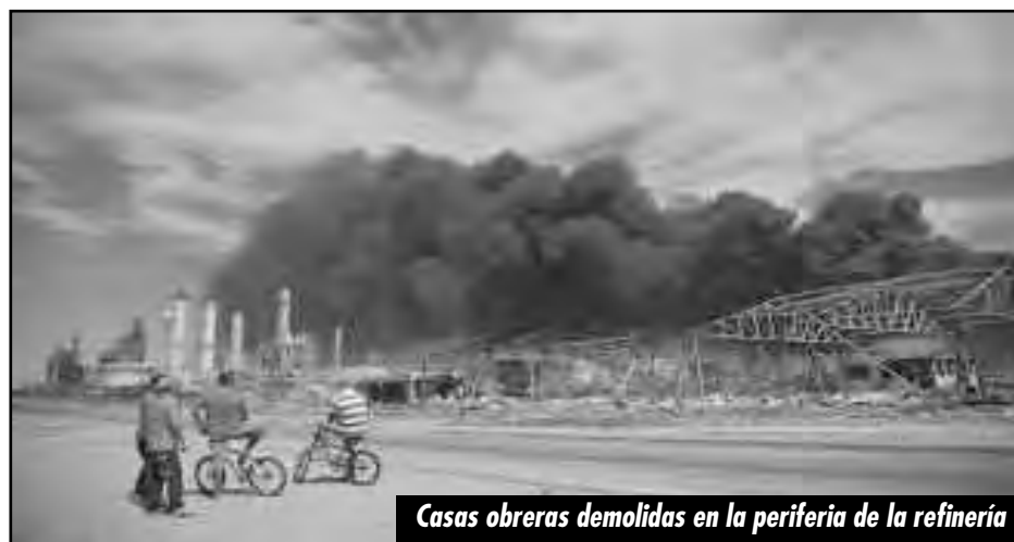
Casas obreras demolidas en la periferia de la refinería

Es conocido por el pueblo venezolano que en reiteradas ocasiones se han realizado llamados al gobierno nacional, denunciando las malas condiciones en las que los trabajadores operan en la industria petrolera, y no es un llamado realizado solo por los petroleros; sino, por los trabajadores de Alcasa, Venalum, Ferrominera, Corpoelec, Pescalba, IOSA, ALTUSA, ALENTUY, TECOVEN, PETROCASA, Pro Arepa, Alcaldías, Educadores, de la Salud, PODECAR, Cerámicas Caribe,