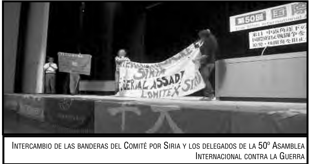
INTERCAMBIO DE LAS BANDERAS DEL COMITÉ POR SIRIA Y LOS DELEGADOS DE LA 50ª ASAMBLEA INTERNACIONAL CONTRA LA GUERRA

El imperialismo “democrático” yanqui sometió, y en la posguerra subsumió, al Japón “fascista”, con dos bombazos atómicos en Hiroshima y Nagasaki, donde murieron centenares de miles de personas. EE.UU. hizo esto, inclusive cuando Japón ya se había rendido en la guerra, con un doble objetivo: definir quién era el