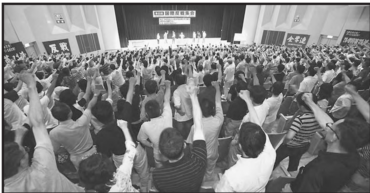
DIRIGENTES DE LA FLTI JUNTO A MIEMBROS DE LA JRCL-RMF, DELEGADOS DE LOS OBREROS INTERNACIONALISTAS DE JAPÓN Y DE LA JUVENTUD REVOLUCIONARIA ZENGAKUREN, EN LA 50ª ASAMBLEA INTERNACIONAL CONTRA LA GUERRA

¡Digamos la verdad! Hoy la clase obrera y los explotados de Siria resisten con fusiles. Estos fusiles los compran las masas vendiendo sus propiedades y los obtienen asaltando las comisarías y de la mano de los soldados rasos que se pasan al combate de los explotados. Ningún general asesino de los que “se