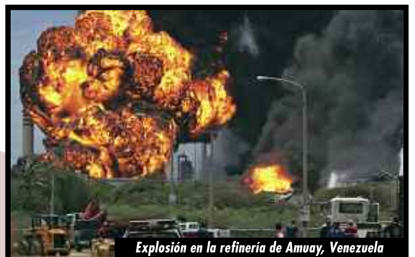
Explosión en la refinera de Amuay, Venezuela

¡UNA VERDADERA ESTAFA CONTRA LA REVOLUCIÓN SOCIALISTA!