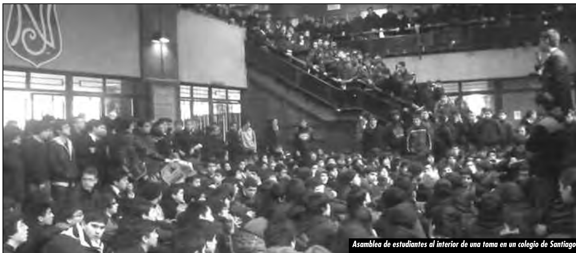
Asamblea de estudiantes al interior de una toma en un colegio de Santiago

¡Hay que unir nuestro combate con las luchas de nuestros hermanos de todo el continente y el mundo entero! ¡Por la unidad de las filas de la clase obrera chilena con las de todo el proletariado del continente para luchar por la expropiación, sin pago y bajo control obrero, de todos los monopolios imperialistas que desangran y saquean nuestras naciones!