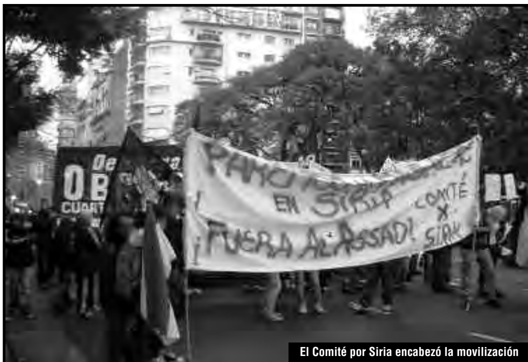
El Comité por Siria encabezó la movilización

Los compañeros del Comité en defensa de las masas sirias de Argentina leyeron el llamamiento a toda la clase obrera mundial que desde Siria realizaron el Comité de Obreros Voluntarios Internacionalistas y la Brigada Sedof al-Laith (Brigada León Sédov) , solidarizándose con sus hermanos de clase de Sudáfrica y por el triunfo de la