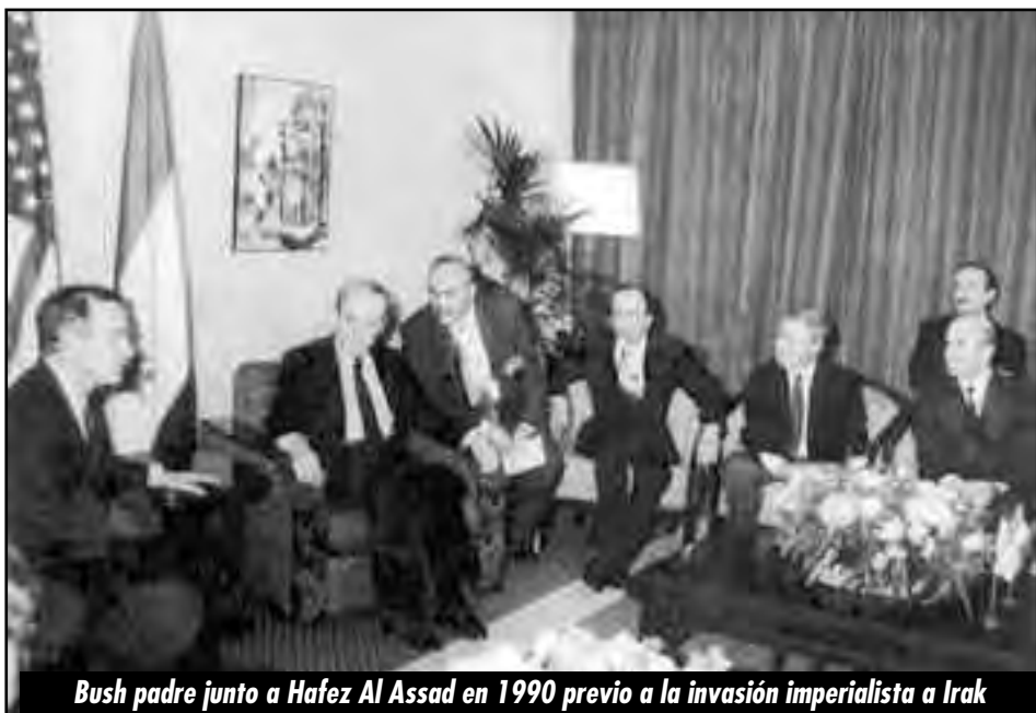
Bush padre junto a Hafez Al Assad en 1990 previo a la invasión imperialista a Irak

Insistimos, hablamos y denunciemos a las revolu-