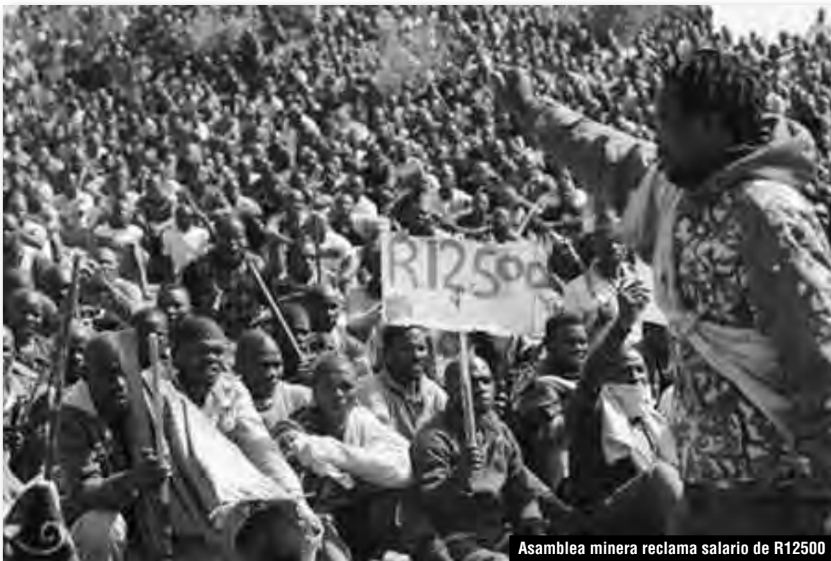
Asamblea minera reclama salario de R12500

¡La clase obrera de Inglaterra y EE.UU. tiene en sus manos la tarea de saldar cuentas en las calles de Londres y Wall Street con la patronal de Anglo-American, Lonmin y demás transnacionales de su propia burguesía imperialista! Ellos son los que saquean el África martirizada, súper-explotan a la clase obrera esclavizada y financian a los gobiernos contrarrevolucionarios del Sur de África como el de Zuma. Son esos mismos piratas ingleses que reprimieron salvajemente a los jóvenes obreros que se sublevaron en 2011 en Tottenham. ¡Que se incendien las calles de toda