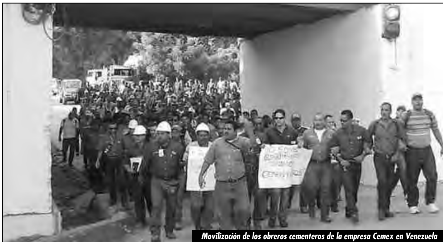
Movilización de los obreros cementeros de la empresa Cemex en Venezuela

Para ello, las tareas del momento son: ¡Congreso obrero YA! ¡Que se voten un delegado cada 100 trabajadores, sin burócratas ni patrones, para unificar todas las demandas en un solo pliego de reclamos, para luchar por todo! A este congreso lo defenderemos con los métodos de la clase obrera ¡Comités de autodefensa armados! ¡Disolución de todas las policías! ¡Hay que organizar los piquetes de autodefensa, que vayan