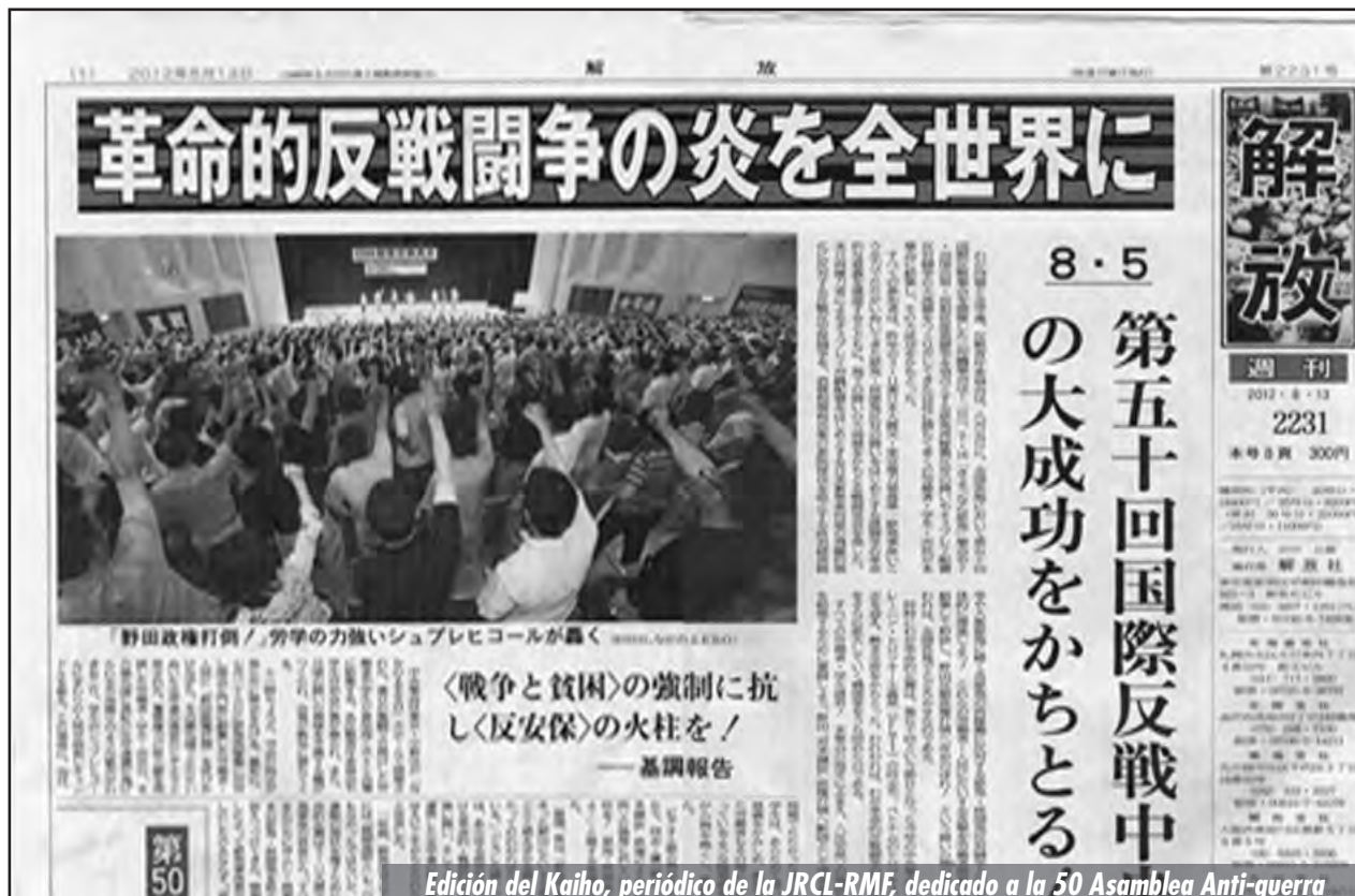
Edición del Kaiho, periódico de la JRCL-RMF, dedicado a la 50ª Asamblea Anti-guerra

COMITÉ EJECUTIVO INTERNACIONAL DE LA FRACCIÓN LENINISTA TROTSKISTA INTERNACIONAL