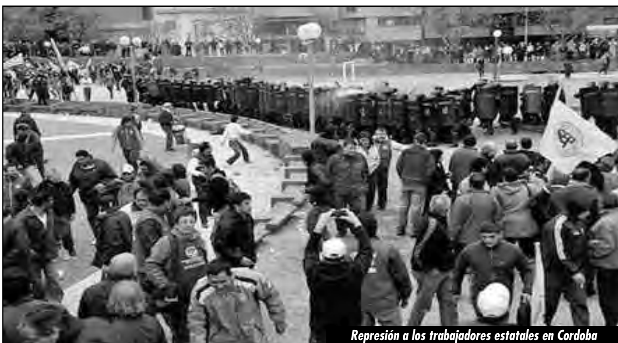
Represión a los trabajadores estatales en Córdoba

Lo que se merecen todos los políticos patronales y los explotadores es un levantamiento obrero como el de los mineros de Lonmin en Sudáfrica, y el de las masas revolucionarias del Norte de África y Medio Oriente, para que su destino sea el de Ben Alí, Mubarak y Khadafy. ¡Ni la Kirchner, Ni Scioli, Ni De La Sota, Ni Macri, ni los gorilas de la UCR! ¡Abajo la estafa de la "revolución bolivariana"! Que vuelva a tronar en las calles el grito de guerra de la revolución del 2001 "Que se vayan todos y no quede ni uno solo" .